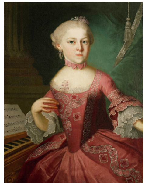
Maria Anna Mozart aka 'Nannerl'

Vandaag is Mozart wereldberoemd en wordt hij nog altijd gezien als een muzikaal genie!