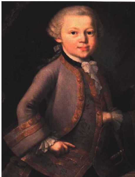
Wolfgang Amadeus Mozart aka 'Wolferl'